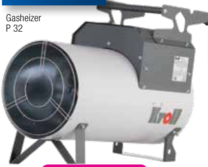
Gasheizer P 32